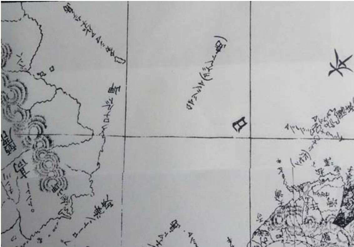
＜図 2＞松島付近の拡大図

この拡大図に対応するコルトンのオリジナル地図が＜図 3＞である。麴陵島は＜図 3＞では「Matsu sima, I. Dagelet」、＜図 2＞では「マツシマ(タゲレト島)」と表記された。このほかに存在しない島が＜図 3＞では「Taka sima, I. Argonaute」、＜図 2＞では「タカシマ アルゴナムテ島」として麴陵島西北側に表記された。これらの地図の系統は、シーボルト(P. Siebold)が 1840 年に作成した「日本国地図(KARTE von JAPANISCHEN REICHE)」に由来し、ヨーロッパで広く流布された。一方、これらの地図にはリアンクール島、すなわち独島は表記されなかった。